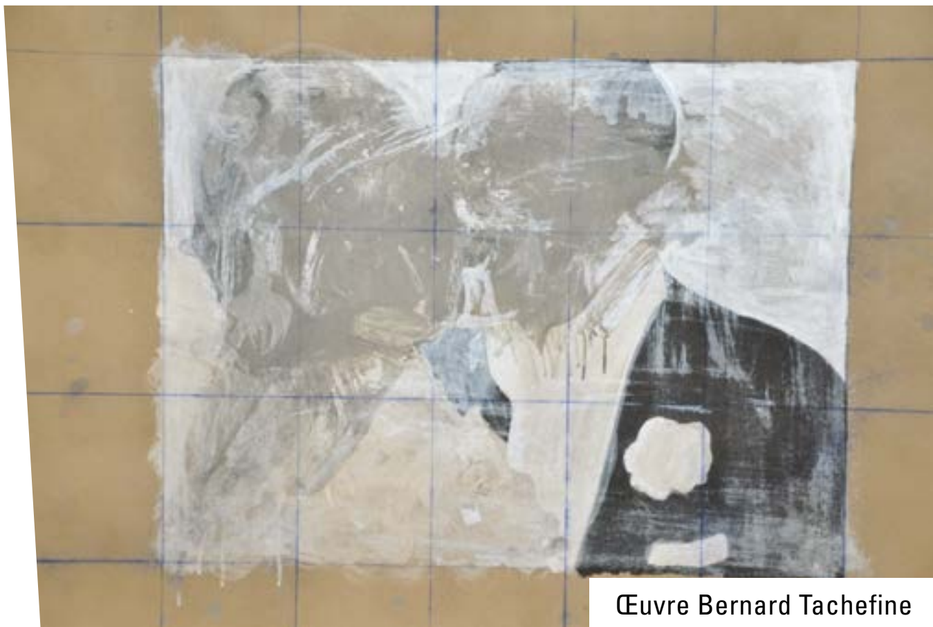
Œuvre Bernard Tachefine

Ses cours s'adressent aussi bien aux adultes