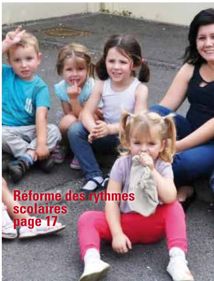
Réforme des rythmes scolaires page 17

LIANCOURT MAGAZINE, le journal d'information des Liancourtois. N° 54 : octobre 2014