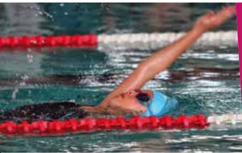
Le Club Nautique Du Liancourtois page 29