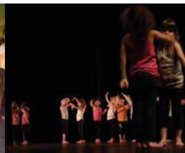
"Danse à l'école" page 22