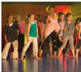
"Let's Dance" page 16

32 Agenda Novembre - décembre 2014 Janvier - février - mars 2015